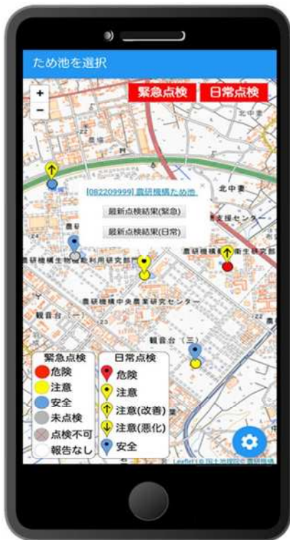
▲ 地図画面イメージ