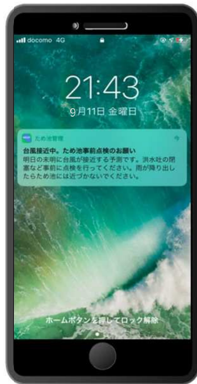
▲ プッシュ通知表示イメージ

ため池管理者の方向けに、「 ため池管理アプリ 」が登場！ ぜひ、ご活用ください。